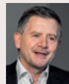
Erich Harsch Hornbach Baumarkt AG